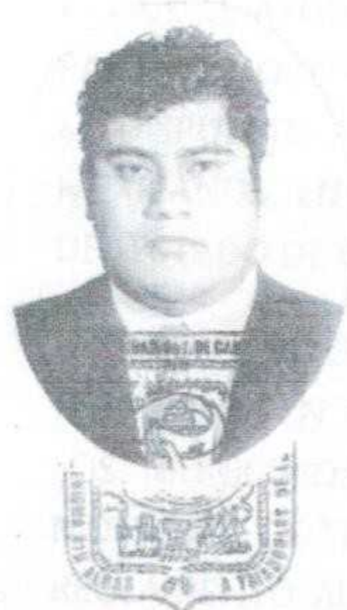
Firma del Interesado